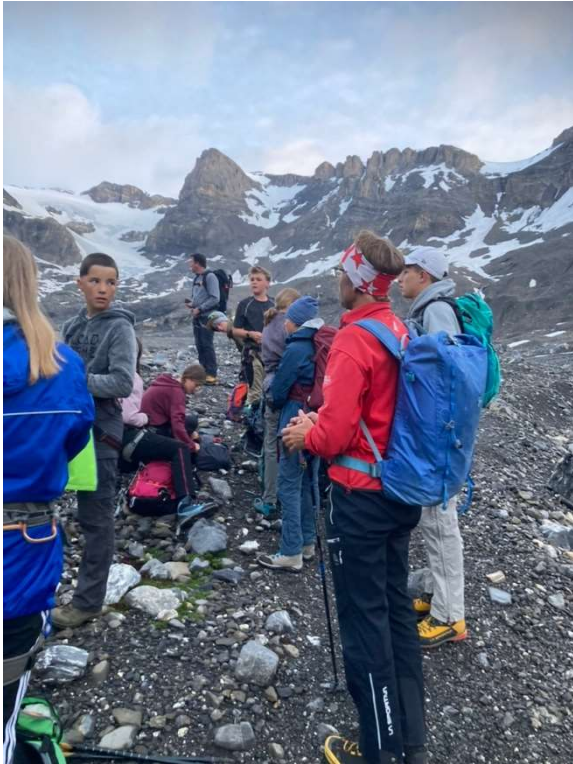
Aufstieg zum Gletscher