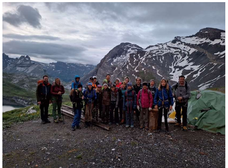
Die Gruppe um 05.15 Uhr vor dem Abmarsch

Der Aufstieg zum Gletscher verlief auf einem gut erkennbaren Weg und wir kamen schnell voran. Beim Gletscher montierten wir unsere Steigeisen und erhielten vom Bergführer Instruktionen, wie man sich auf einem Gletscher verhält, wie man in einer Seilschaft geht, auf was zu achten ist. Anschliessend wurden die Seilschaften zusammengestellt. Wir waren bereit für den Aufstieg zum Gipfel. Auf dem Gletscher lag eine kleine Neuschneesicht, was uns überraschte. Der kalte Wind, der am Morgen noch geweht hatte, hatte nachgelassen und so hatten wir schon bald sehr warm.