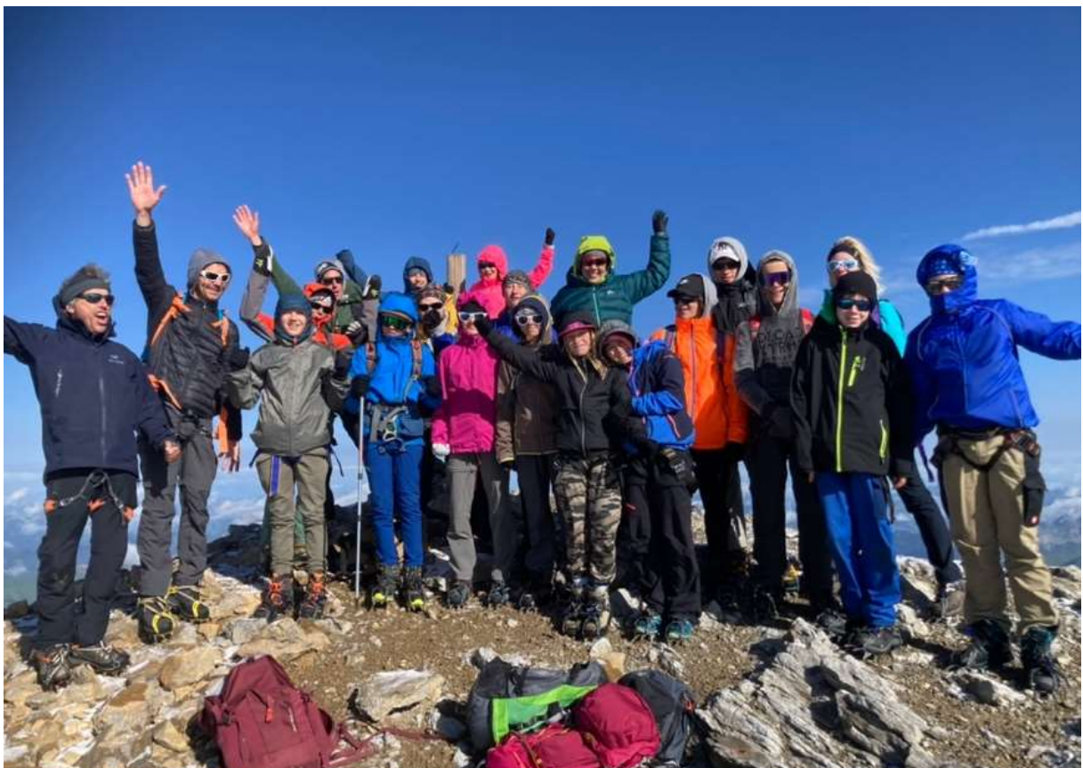
Auf dem Strubel

2 Stunden später hatten wir es geschafft, wir waren auf dem Gipfel angekommen. Stahlblauer Himmel, Sonnenschein, ein unglaublich überwältigendes Panorama, das Matterhorn, die