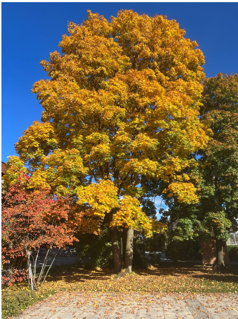
Felsenbirne und Ahorn beim Schulhaus Kirchdorf, 10.10.2022

Oktober 2022, Ausgabe 2, Schuljahr 2022/23